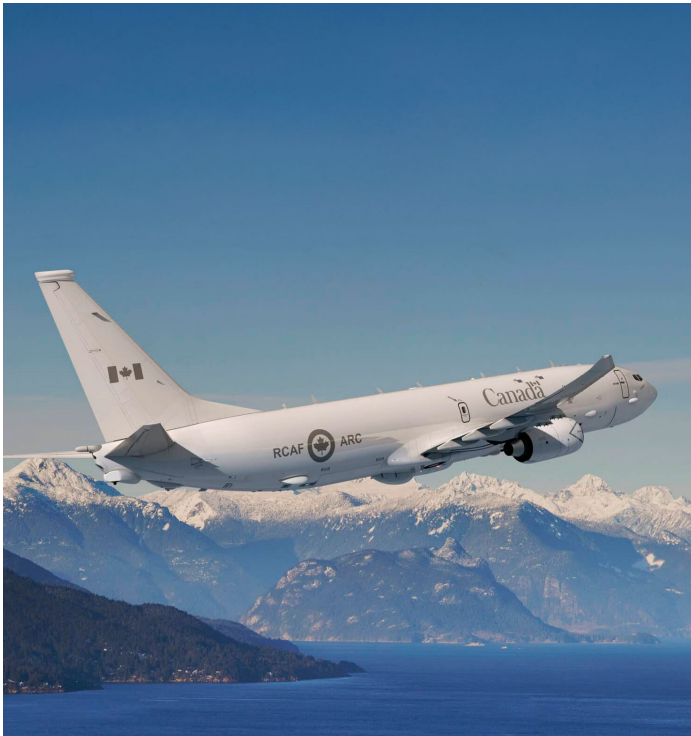
Le P-8A Poséidon

Le Canada s'associe aux É.-U. pour défendre l'Amérique du Nord et accélérer l'innovation dans les secteurs de l'aérospatiale et de la défense