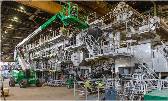
Installation de Bear Island. Photo : Cascades