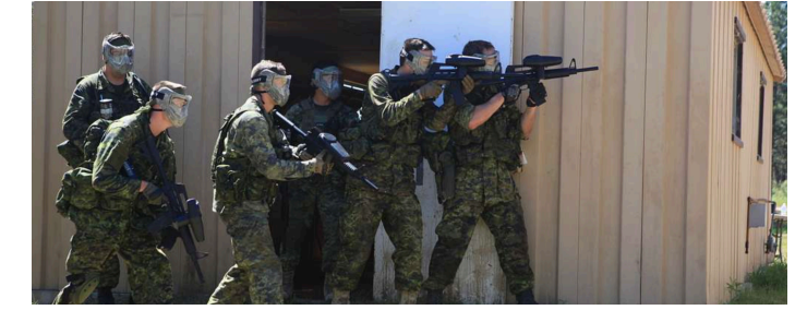
Les Forces armées canadiennes sécurisent l'espace dans le cadre de l'exercice Golden Coyote.

Beth Richardson Consule général mnpls@international.gc.ca (612) 333-4641