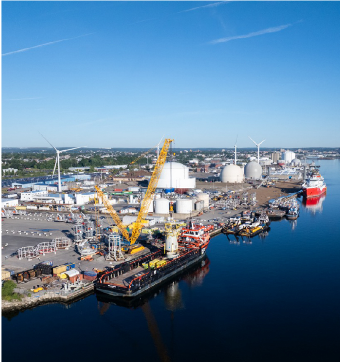
ProvPort, exploité par Waterson Terminal Services.