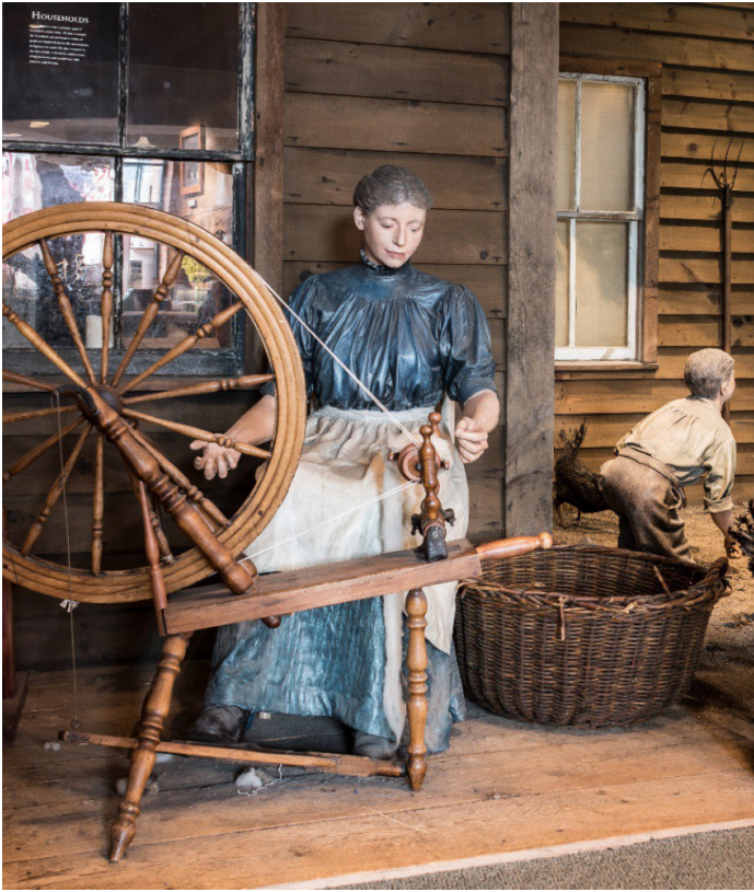
Le Museum of Work and Culture à Woonsocket, Rhode Island.