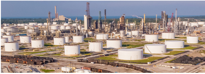
Usine de Cenovus à Toledo.