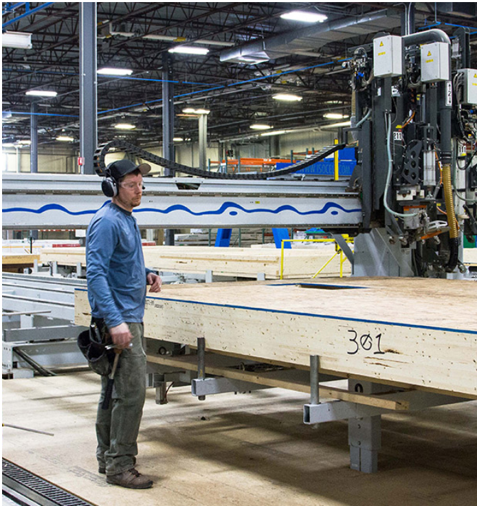
Usine Bensonwood à Walpole.