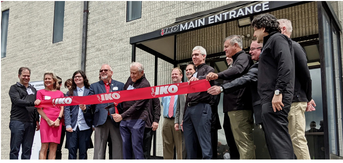
Cérémonie d'inauguration des nouvelles installations d'IKO à Hagerstown.