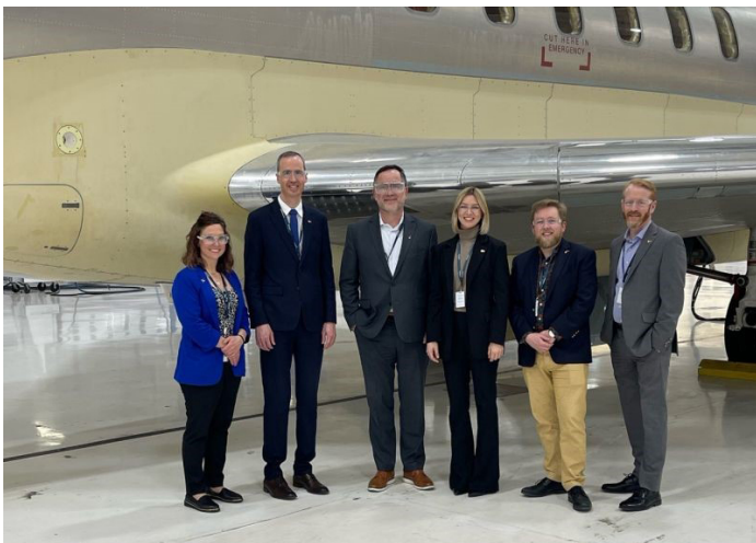
Le Challenger 650 de Bombardier Défense.