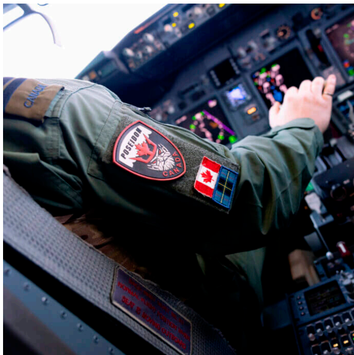
Le P-8A de Boeing.