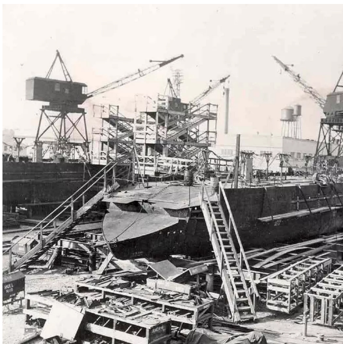
Chantier naval de Wilmington, Delaware, pendant la Seconde Guerre mondiale. Photo : Wilmington (Delaware)