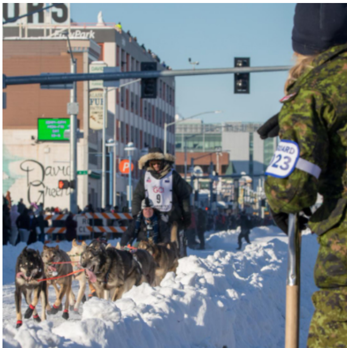
Un membre des FAC observe des courses de chiens de traîneau dans le segment canadien du sentier, à Anchorage.